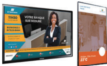
Écran d’affichage dynamique Horizontal et vertical

La solution comprends du matériel et des logiciels pour contrôler, gérer, exploiter vos écrans numériques et vous connecter avec vos clients.