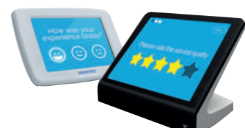
Tablette de recueil d’avis du Client