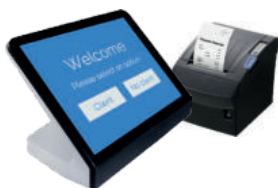
Distributeur de Ticket avec Imprimante Bixolan

Nos logiciels et matériels sont conçus pour fonctionner ensemble , afin d’alimenter les systèmes de files d’attente et de reduire le temps d’attente de vos clients.