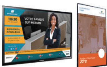
Écran d'affichage dynamique Horizontal et vertical

La solution comprends du matériel et des logiciels pour contrôler, gérer, exploiter vos écrans numériques et vous connecter avec vos clients.