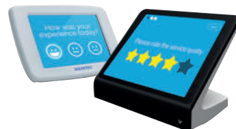
Tablette de recueil d'avis du Client