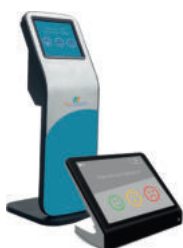
Kiosque d'avis Client

Découvrez et évaluer la satisfaction globale du client à l'égard de votre service, Notre solution de mesure de satisfaction utilise CSAT, (pour Customer Satisfaction) et NPS (Net Promoter-Score).