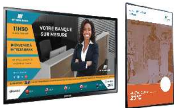
Écran d'affichage dynamique Horizontal et vertical

La solution comprends du matériel et des logiciels pour contrôler, gérer, exploiter vos écrans numériques et vous connecter avec vos clients.