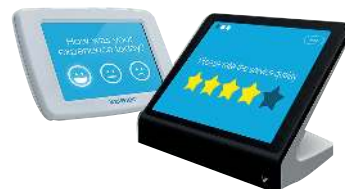
Tablette de recueil d'avis du Client