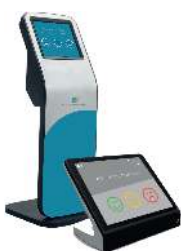
Kiosque d'avis Client

Découvrez et évaluer la satisfaction globale du client à l'égard de votre service, Notre solution de mesure de satisfaction utilise CSAT, (pour Customer Satisfaction) et NPS (Net Promoter-Score).