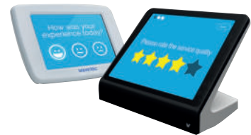
Tablette de recueil d'avis du Client