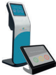
Kiosque d'avis Client

Découvrez et évaluer la satisfaction global du client à l'égard de votre service, Notre solution de mesure de satisfaction utilise CSAT, (pour Customer Satisfaction) et NPS (Net Promoter-Score).