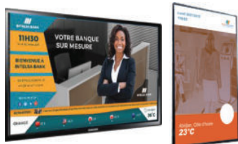
Écran d’affichage dynamique Horizontal et vertical

La solution comprends du matériel et des logiciels pour contrôler, gérer, exploiter vos écrans numériques et vous connecter avec vos clients.