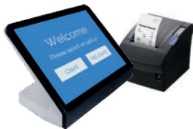
Distributeur de Ticket avec Imprimante Bixolan

Nos logiciels et matériels sont conçus pour fonctionner ensemble , afin d’alimenter les systèmes de files d’attente et de reduire le temps d’attente de vos clients.