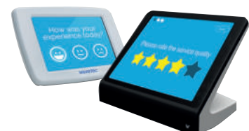
Tablette de recueil d’avis du Client